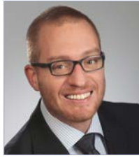
Prof. Dr. med. T. Knoll Klinik für Urologie Klinikverbund Südwest Klinikum Sindelfingen