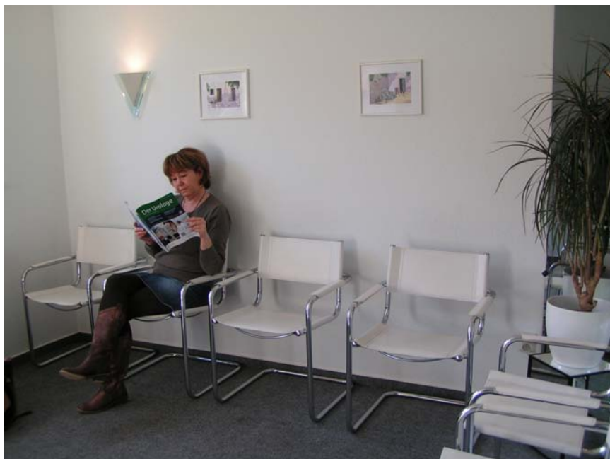
◀ Anfrage für eine TV-Produktion: Was gehört in das Wartezimmer einer urologischen Praxis?